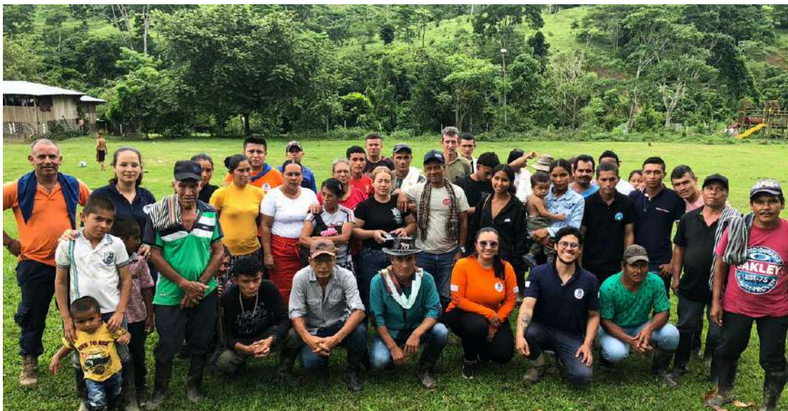
Foto : Jornada de Sensibilización ambiental vereda La Esperanza – Apartadó.

Estas actividades reforzaron el compromiso con la sostenibilidad ambiental y fomentaron la adopción de prácticas responsables con el entorno.